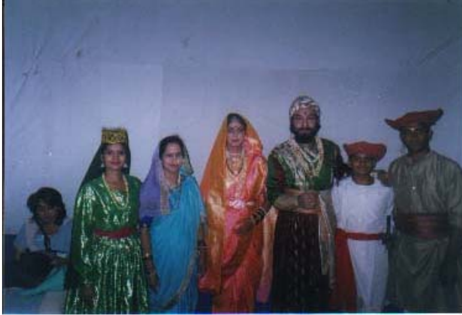
जाणता राजा नाटक में शिवाजी का परिवार

शिवाजी ने कुल दस विवाह किए। १६७४ में, राज्याभिषेक के समय, उनके दो पुत्र तथा छः पुत्रियाँ थीं। उस समय ज्येष्ठ पुत्र संभाजीराजे की माता का देहांत हो चुका था तथा संभाजी की सौतेली माता सोयराबाईसाहेब महारानी के पद पर आसीन थी। संभाजीराजे युवराज थे। संभाजीराजे तथा महारानी के बीच लगातार खटपट चलती रहती थी। इस खटपट से खिन्न हो कर संभाजीराजे १३ दिसम्बर १६७८ को मुगल सरदार दिलेरखान के खेमे में रहने चले गये। संभाजीराजे गद्दार हो गये पर पुत्रमोह से ग्रसित शिवाजी ने उन्हें युवराज के पद से नहीं हटाया।